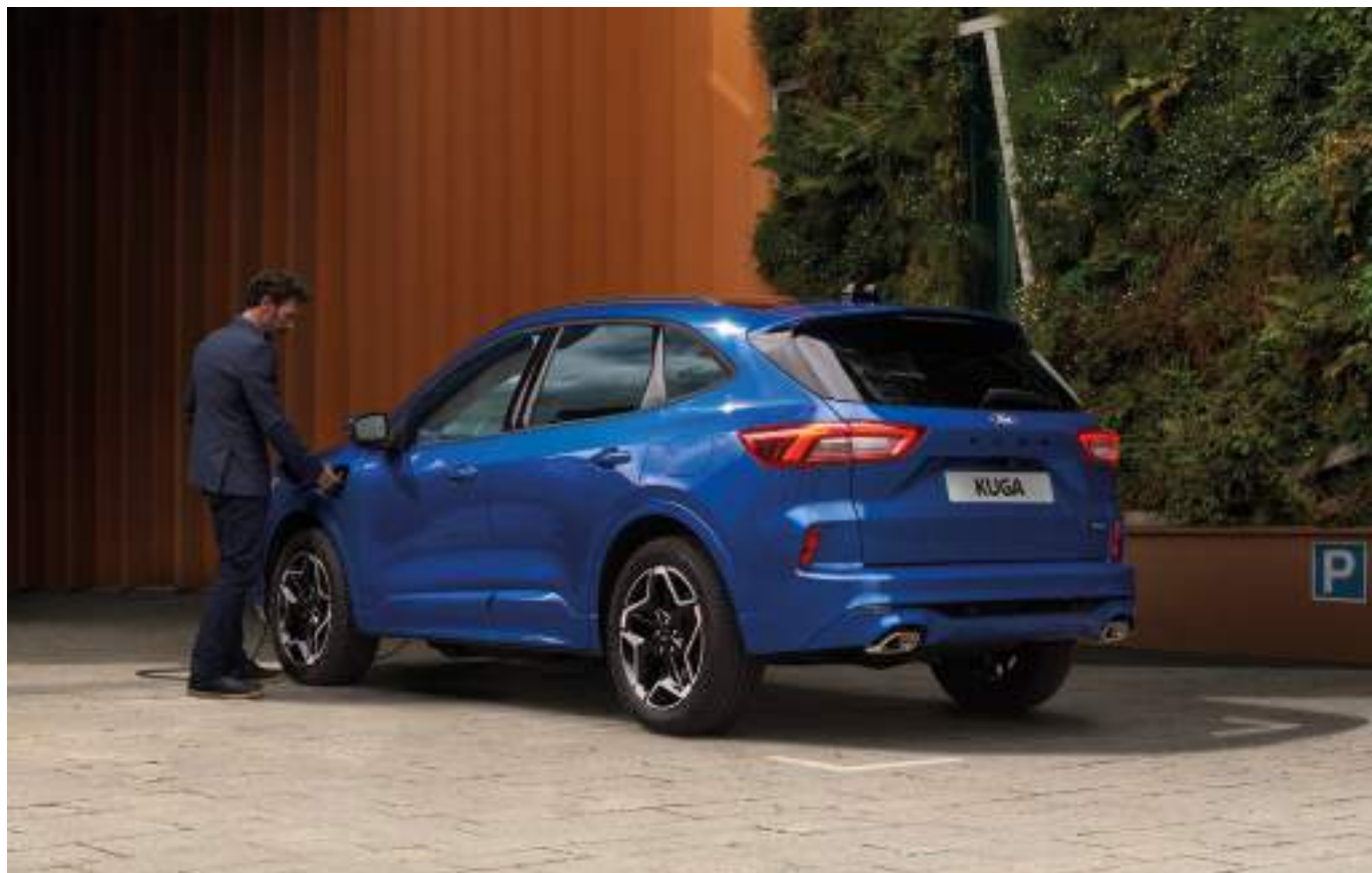
Ford Kuga® w wersji ST-Line X (PHEV) z opcjonalnym wyposażeniem

Poznaj wszystkie zalety aplikacji Ford. Szczegóły u Twojego Dealera Forda.