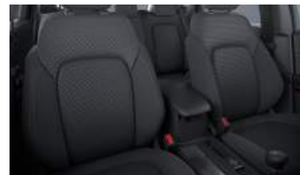
Ford Kuga® w wersji Titanium w kolorze Frozen White (bez dopłaty) Wnętrze: Tapicerka materiałowa (wyposażenie standardowe)