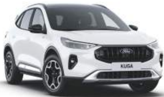
FROZEN WHITE - lakier zwykły