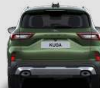
Szerokość całkowita ze złożonymi lusterkami: 2000 mm