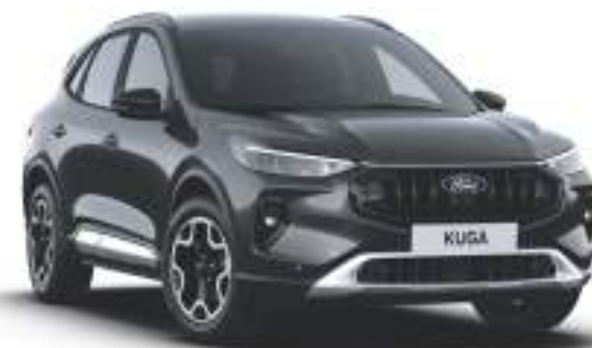
MAGNETIC GREY - lakier metalizowany specjalny

Lakier niedostępny dla wersji BlueCruise