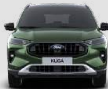
Szerokość całkowita z lusterkami bocznymi: 2177 mm