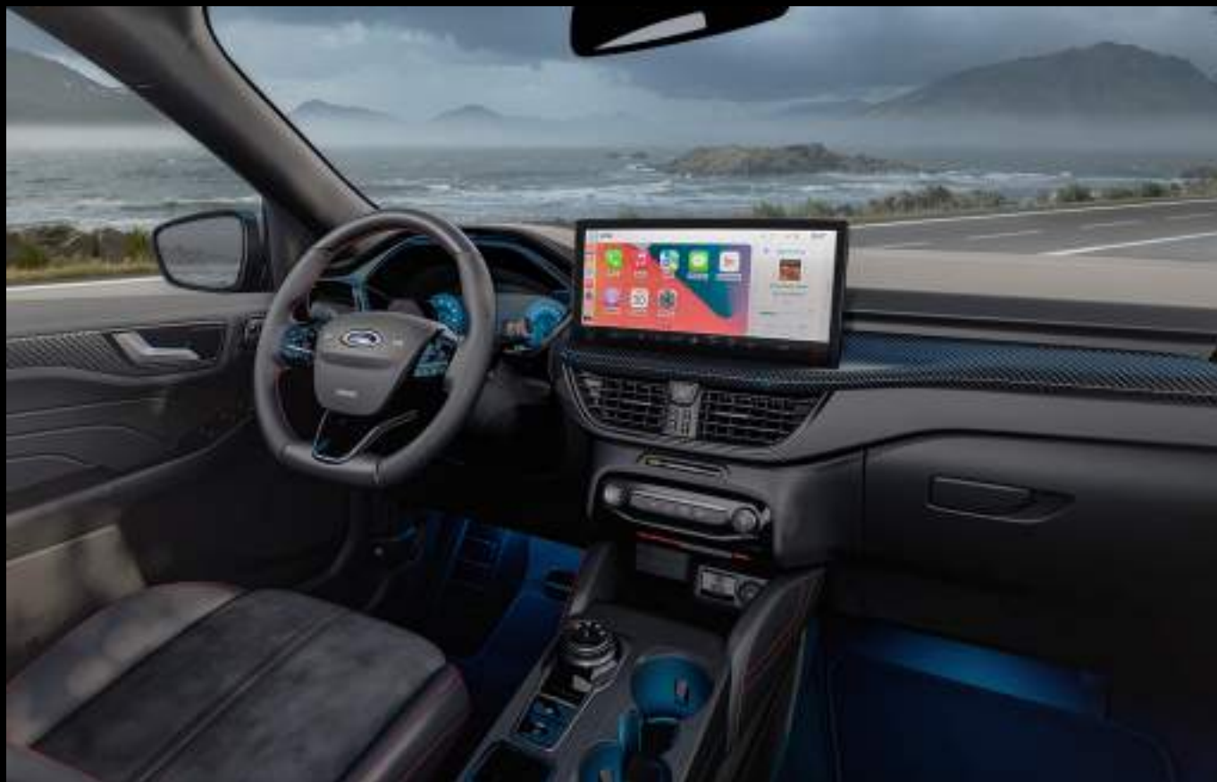
Ford Kuga® w wersji ST-Line X z opcjonalnym wyposażeniem

Kuga® została wyposażona w najnowszą wersję systemu SYNC 4 z dużym, czytelnym ekranem dotykowym o przekątnej 13,2". Obsługa stała się szybka i intuicyjna, wszystko czego potrzebujesz, masz zawsze pod ręką. Bezprzewodowa obsługa Apple CarPlay™ i Android Auto™ umożliwia pełną integrację z Twoim smartfonem, dzięki czemu możesz obsługiwać najpopularniejsze aplikacje zainstalowane w telefonie bezpiecznie i komfortowo.