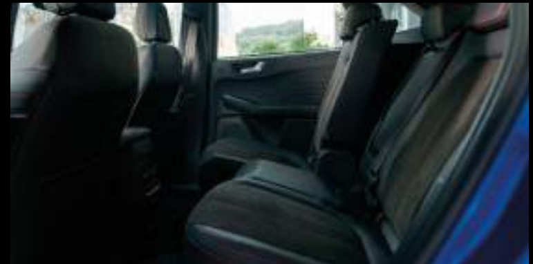
Przesuwana tylna kanapa

Wyposażenie standardowe wersji ST-Line X, Active X i BlueCruise Edition