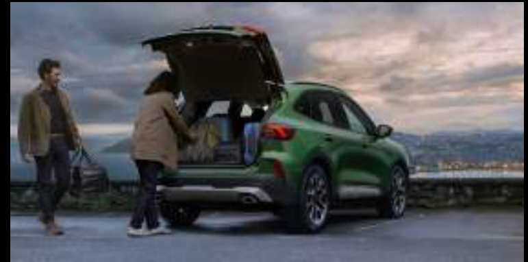
Elektrycznie i bezdotykowo otwierana / zamykana kłapa bagażnika

Wyposażenie standardowe wersji ST-Line X, Active X i BlueCruise Edition