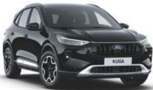
AGATE BLACK - lakier metalizowany

Lakier niedostępny dla wersji BlueCruise