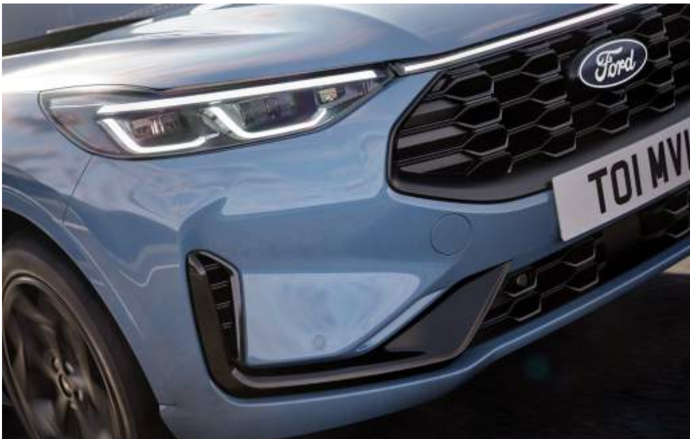
Ford Kuga® w wersji BlueCruise

Kuga BlueCruise Edition wyróżnia się wyrafinowaną grą kontrastów – chłodny lakier Vapor Blue harmonijnie zestawiono z czarnym dachem, lusterkami i 19-calowymi felgami aluminiowymi, podkreślając nowoczesny i elegancki charakter modelu. Tę samą estetykę odnajdziemy we wnętrzu, gdzie akcenty Nordic Blue i starannie dopracowane detale tworzą spójną, szlachetną atmosferę. Całość dopełnia technologia BlueCruise – zaawansowany system umożliwiający jazdę bez użycia rąk na wybranych odcinkach autostrad.