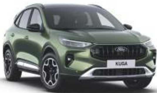
BURSTING GREEN - lakier metalizowany

Lakier niedostępny dla wersji BlueCruise