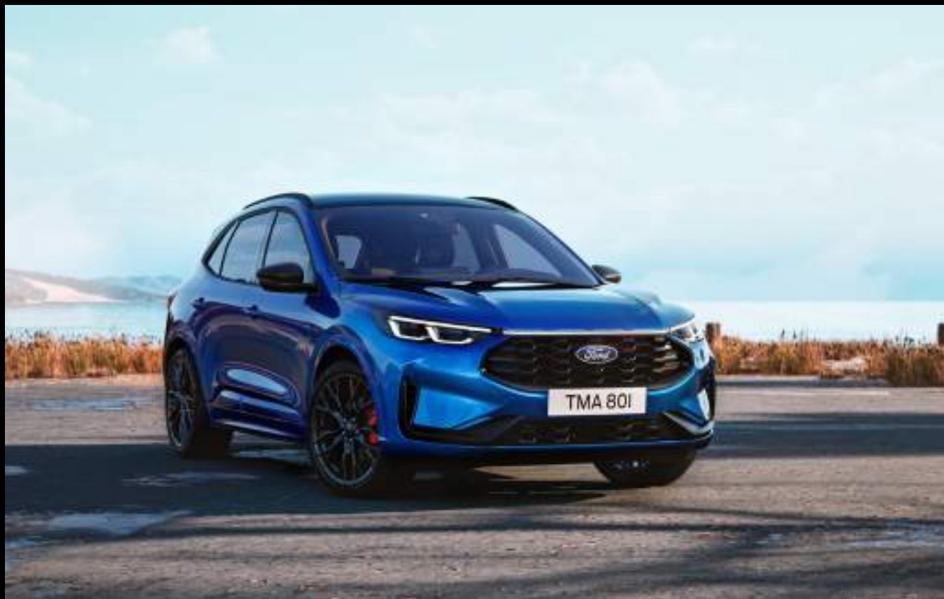
Ford Kuga® w wersji ST-Line X z pakietem Black oraz opcjonalnym wyposażeniem. Kolor nadwozia: Desert Island Blue (opcja)

Zaawansowane technologie wspomagające kierowcę sprawiają, że każda podróż staje się bezpieczniejsza i bardziej intuicyjna, a komfortowe, przestronne wnętrze zachwyca designem i najwyższą jakością wykończenia. Oszczędne, wydajne napędy hybrydowe (Full Hybrid i Plug-In Hybrid) to radość jazdy oraz ekonomia. Dla ceniących klasyczne napędy - Nowa Kuga® oferuje również niezawodny silnik benzynowy EcoBoost. Kuga® - to SUV stworzony dla tych, którzy chcą czuć wolność i pewność na każdej drodze.