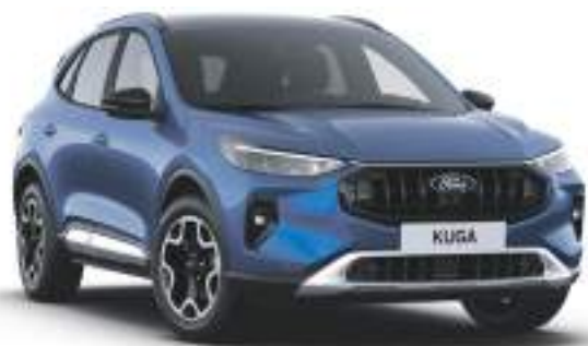
DESERT ISLAND BLUE - lakier metalizowany specjalny