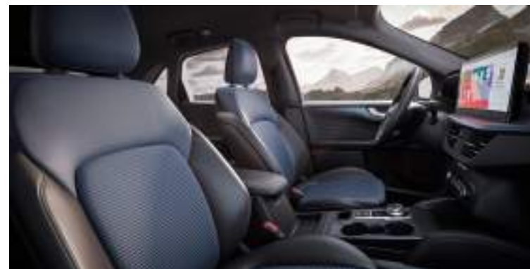
Unikalna tapicerka częściowo skórzana Wyposażenie standardowe wersji BlueCruise