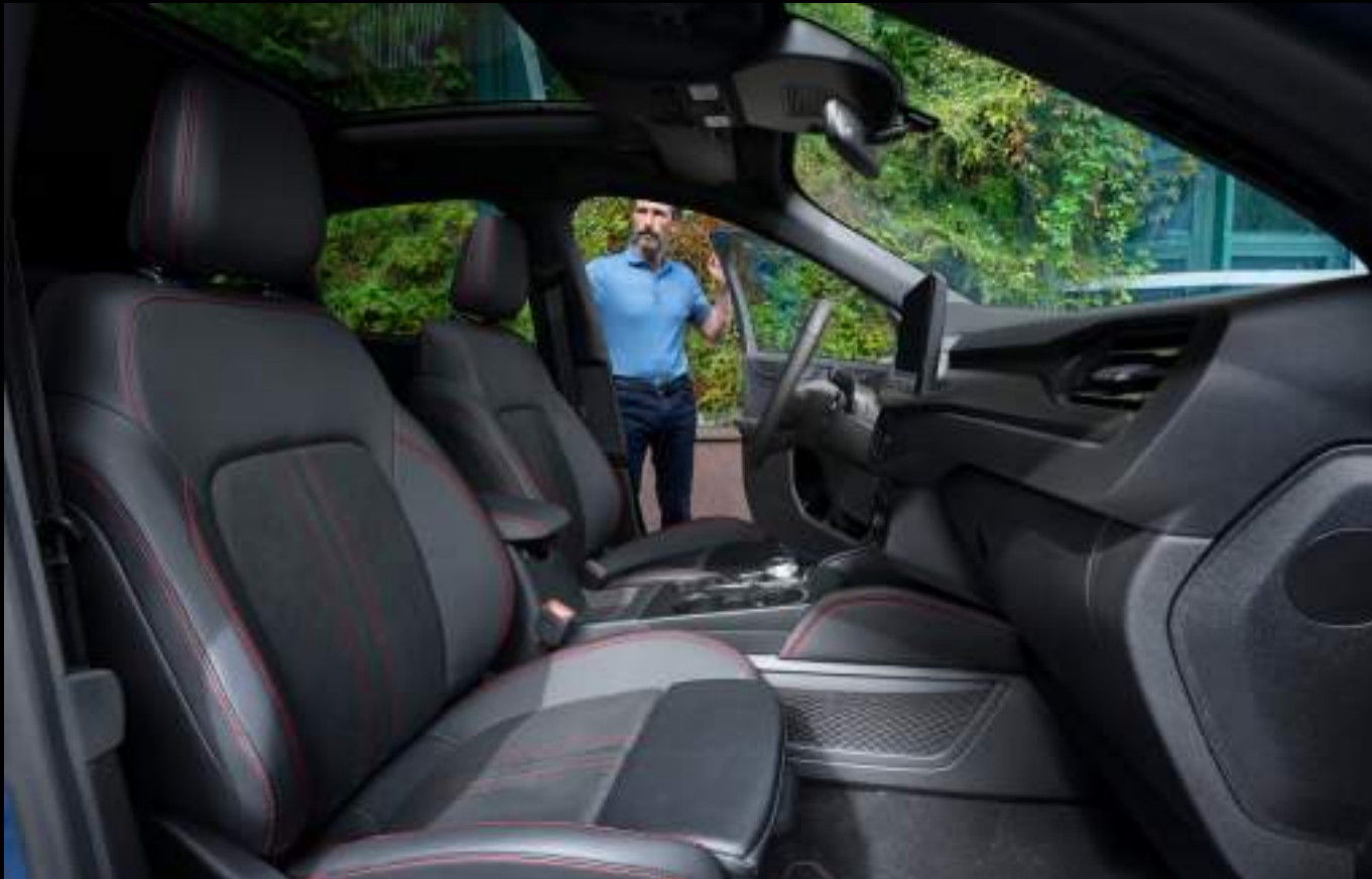
Ford Kuga® w wersji ST-Line X z opcjonalnym wyposażeniem

Ford Kuga® to SUV, który nie boi się wyzwań - nawet tych z hakiem. Kuga® PHEV oraz Kuga® FHEV AWD imponują zdolnością holowania, oferując maksymalną masę przyczepy aż do 2100 kg - to jeden z najlepszych wyników w tej klasie.