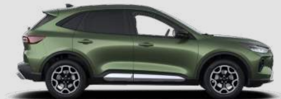
Długość całkowita Titanium: 4616 mm, ST-Line / ST-Line X / BlueCruise: 4622 mm, Active X: 4650 mm