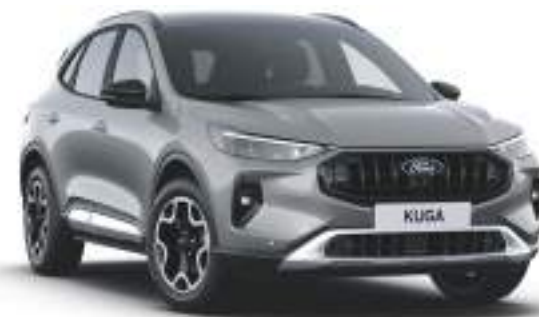
SOLAR SILVER - lakier metalizowany

Lakier niedostępny dla wersji BlueCruise