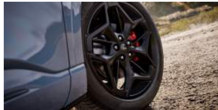
19"obrócze kół ze stopów lekkich Wyposażenie standardowe wersji BlueCruise